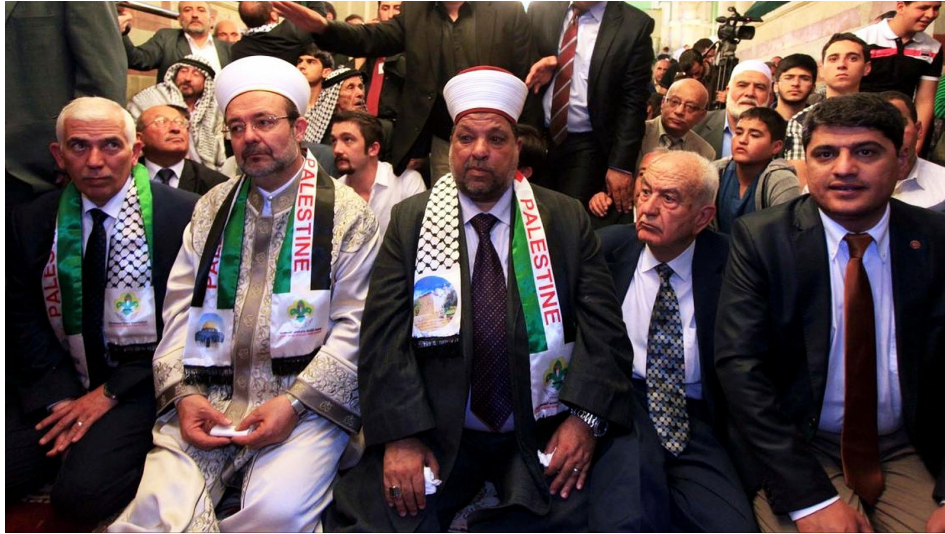
האורח הטורקי לובש את צעיף חמאס ולא את הצעיף של פת"ח, למרות שפיתח הוא שאירח אותו בחברון

התנועות האסלאמיות מערערות על הסטטוס-קוו, מטילות דופי בירדן על שהיא שואבת את סמכותה מתוקף הסכם עם ישראל, דוחקות את ירדן ומקדמות את טורקיה.