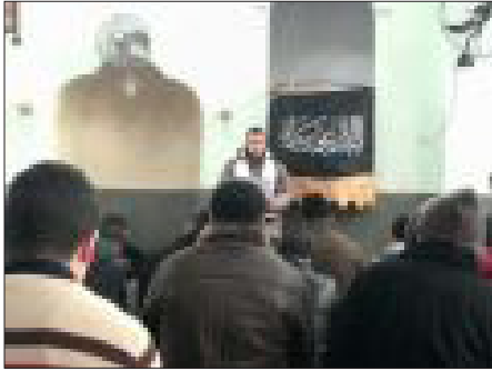
עצרת תחריר באוניברסיטת אל-קודס באבו דיס – מתוך דף הפייסבוק של הסטודנטים

כותב שורות אלה פגש את אנשי תחריר במסגד בבית-צפפא (יש להם עוד מסגד בבית-חנינא) בתיווכו של סוחר מזרח-ירושלמי מכובד, בשולי ועידת אנאפוליס, בנובמבר 2007. הדברים ששמעתי אז תקפים גם היום. שאלתי מדוע עשו הפגנות סוערות נגד הוועידה בכל הגדה המערבית, ודווקא בירושלים היו שקטים, חרף השפעתם העמוקה בה. אנשי-שיחי ענו כי עיקר עניינם בשלב זה הוא המשטרים הערביים שסטו מדרך האסלאם, כמו הרשות הפלסטינית, וכי יומם במסגד אל-אקצא יגיע כאשר ישראל תיסוג מן הרחבה והם ישתלטו עליה 14 ויכריזו על החליפות. כלומר, הם אינם מתעמתים עם ישראל, אבל ברגע שיושג הסכם וישראל תעביר את האחריות על ירושלים לידי משטר ערבי שאינו דוגל בשלטון החליפות – יתפסו הם את החלל הריק.