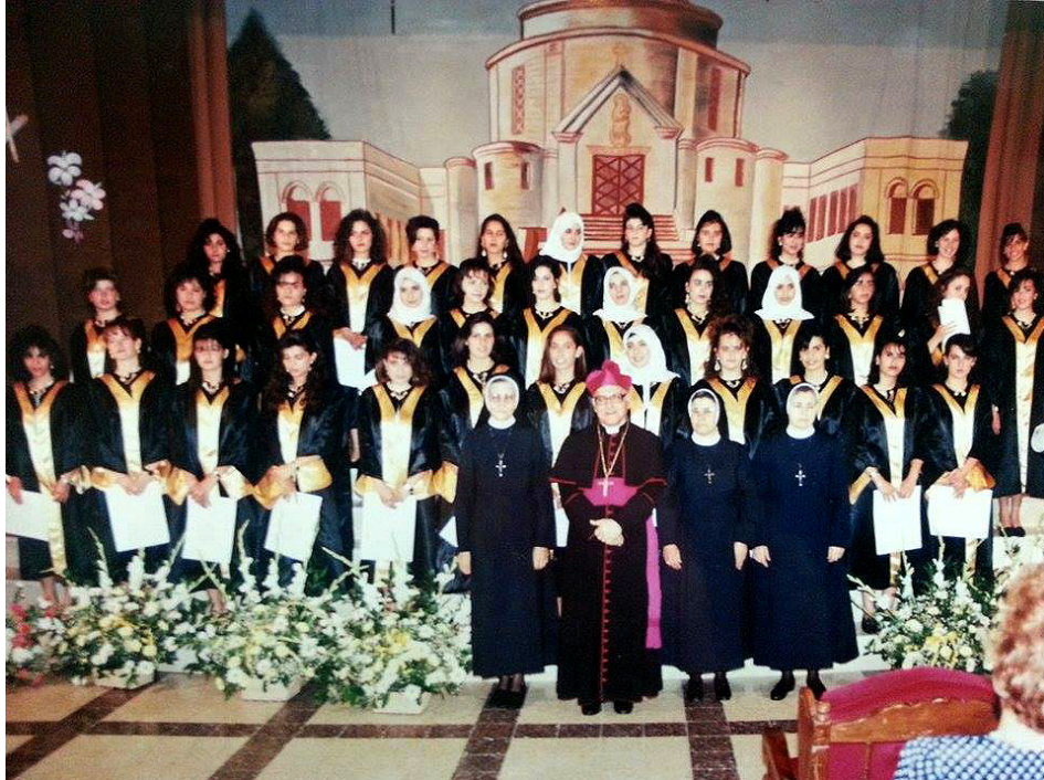
ניצחון החגיגה. השלב הבא: הסרת הצלבנים