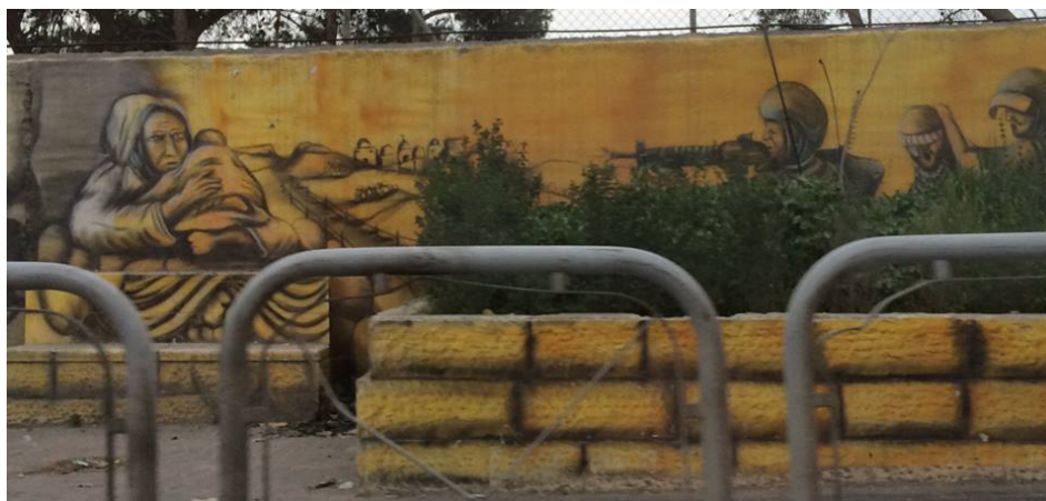
גרפיטי בכפר עקב – ירושלים שמעבר לגדר

חזית החיכוך העיקרית היא בית הספר לבנות "רוזארי" (או "וורדיה") של הוותיקן. התנועות האסלאמיות מסיתות את ההורים המוסלמים להתנגד למדיניות בית הספר, אשר אוסר על התלמידות לחבוש צעיף שנועד להסתיר את שערן. שנים ארוכות עמדה הנהלת בית הספר בלחצים, לא הרשתה לתלמידות לחבוש חיגי'אב והייתה איתנה בדעתה כי אין בכך אפליה דתית. 41 אבל באחרונה שינתה הנהלת בית הספר את עמדתה והתירה את החיגי'אב. 42