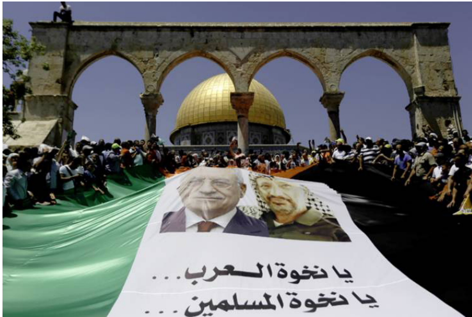
פת"ח מתקשה למלא את הרחבה, ובמקום זה הוא פורס את דגל פלסטיין על המדרגות