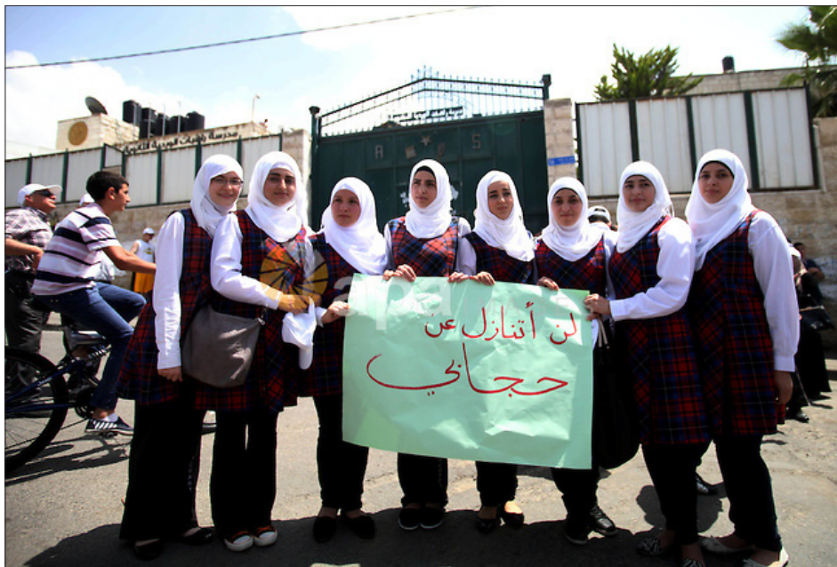
תלמידות בייס רוזארי מפגינות למען החיגיאב מחוץ לבית הספר (מתוך אתר חמאס)

כך שלמרות סבל העם הפלסטיני לא עשו דאעש וקאעידה שום פעולה נגד ישראל. "הם מסיתים נגד המערב, אבל לא עשו שום פעולה נגד ישראל," אמר השגריר באותו משדר. 43