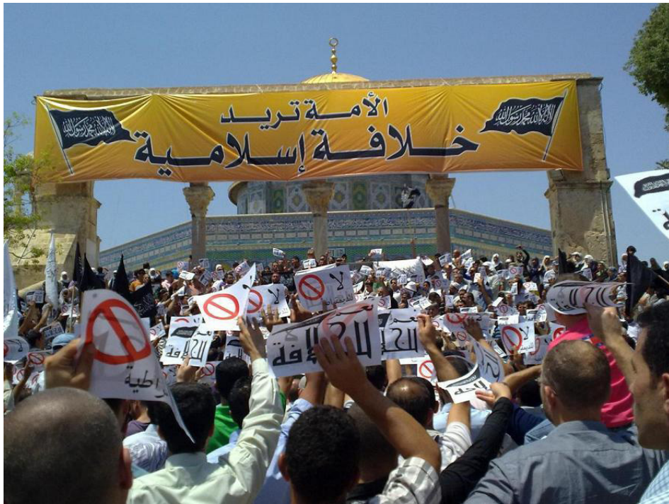
עצרת חיזב תחריר ברחבת אל-אקצא.

בהיעדר מנגנון של בחירות, קשה לאמוד את כוחן של התנועות האסלאמיות הפועלות בירושלים, אבל יש קנה-מידה שעשוי לסייע בהערכת כוחן היחסי: היכולת לכנס המונים ברחבת אל-אקצא (אך לא ברחבי ירושלים; אין אף תנועה שמסוגלת לעשות זאת) ועל פי קנה-מידה זה מפלגת השחרור מצליחה מעל ומעבר לכל היתר.