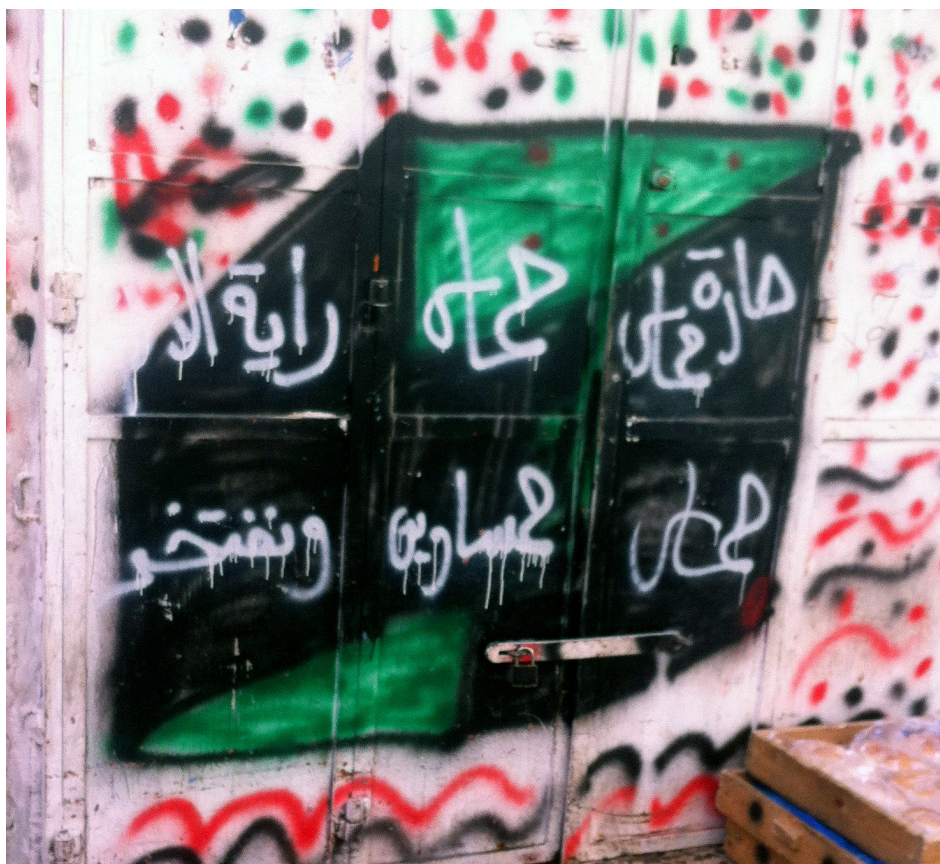
בהיעדר יכולת לכנס עצרות, חמאס מבליטה את נוכחותה בפרהסיה של העיר בכתובות קיר. בתמונה: כתובת של חמאס בשכונת באב א-זהרה: "שכונת חמאס. חמאס היא דגל האסלאם ואנו גאים בה."

על פי מקורות במזרח-ירושלים, חרף כל המפריד בין כל התנועות האלו, יש כמה קווי-דמיון משותפים לכולן, אבל כל אחת מתמודדת עם מצבה בדרך אחרת.