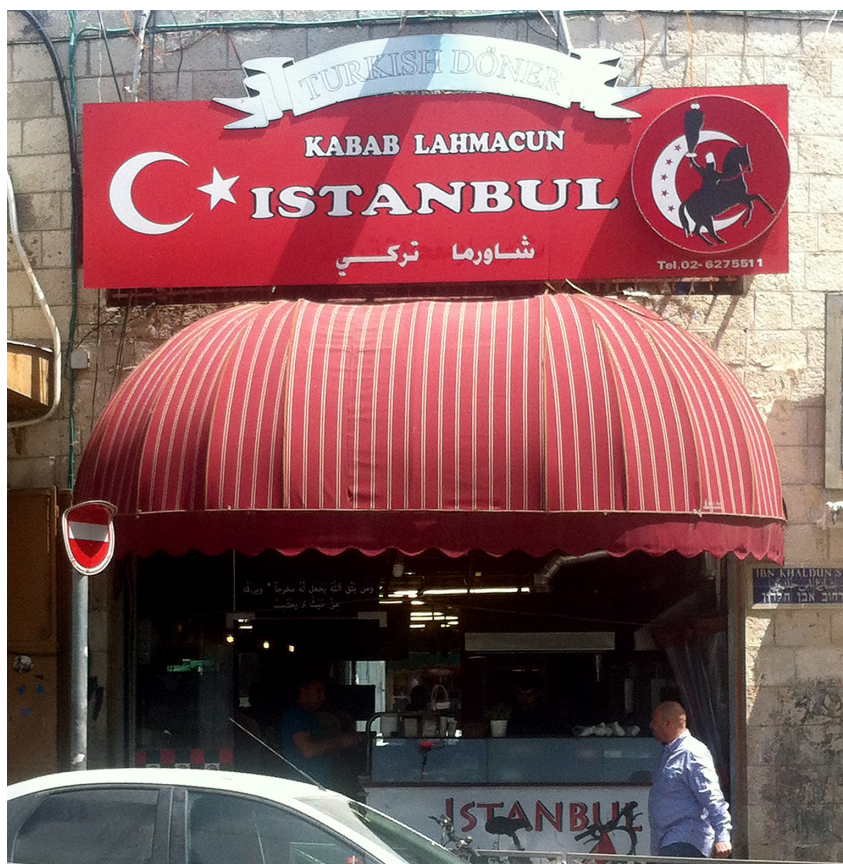
שימו לב לסוס השחור בפינה הימנית - הסוס שכובש את העולם

לגבי התנהגות אנשי פת"ח, זו עולה בקנה אחד עם מדיניות הארגון הנוטה להצטרף ליוזמות של התנועות האחרות. אבל בחינה מדוקדקת של המסרים שהעביר שר הדתות הטורקי בביקורו, אמורה להדאיג את פת"ח. כך למשל, כשביקר בחברון, הוא סירב ללבוש את הצעיף של הרשות הפלסטינית עם הכופיה השחורה-לבנה, ובמקומה חבש את הצעיף הירוק של חמאס.