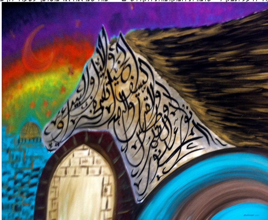
הסוס השחור של דאעש בלובי של מלון במזרח-ירושלים, 4.12.15

בעבר הרחוק תרמה סעודיה שטיחים למסגד אל-אקצא, אבל צעד זה הובן בזמנו כחתיירה תחת מעמד ירדן ויומרתה להתחרות בסעודיה על תפקיד "שומרת המקומות הקדושים" – מה שנראה אז מסוכן לסעודיה, כי ירדן הייתה